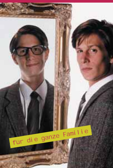
für die ganze Familie

Mit der Intelligenz eines Professors und der Energie eines jugendlichen Liebhabers hält Ken seinen Vortrag "Wie werde ich erfolgreich?". Dabei lassen Witz, spontane Schlagfertigkeit und seine Liebe zum Publikum eine wohltuende Nähe entstehen. Hinzu kommen verblüffende Zauberei , perfektes Timing und geschickte Rhetorik: Die Zuschauer kommen aus dem Lachen und Staunen nicht mehr heraus. Spielend läßt Kens Vielseitigkeit eine unverwechselbare Show entstehen, die bereits mehrfach mit internationalen Preisen ausgezeichnet wurde. Im Juli 2003 wurde er bei der Weltmeisterschaft in Den Haag vor 2500 Fachleuten zum weltbesten Stand-up-Magier gekürt. Sein abendfüllendes Programm "Defekte Effekte" wurde beim Gastspiel in München mit dem "Stern der Woche" ausgezeichnet. "Defekt ist bei ihm gar nichts, und die Effekte serviert er mit Witz und Ironie ganz unaufwändig und scheinbar nebenher", schrieb dazu die Abendzeitung.