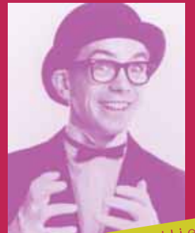
für die ganze Familie

"Ein unscheinbarer, bebrillter Durchschnittstyp mit Jackett und Bowlerhut: 'nichts Besonderes', könnte man denken. Wäre da nicht ein Ghetto-blaster der Übergröße, den er mit blödem Grinsen und in Zeitlupenbewegungen auf die Bühne hievt. Ein Mann und seine Maschine – der beste Freund in einer feindlichen Welt. Aber wenn dann sein Körper explodiert und das Gesicht sich zu etwas unendlich Schrecklicherem als Franksteins Monster verformt, dann ist dies abschreckend und komisch zugleich. Les Bubb's High-Speed-Komik könnte als Metapher auf die Qualen des modernen Lebens gesehen werden: die Ausbrüche manischer Energie sind unterbrochen von ruhigeren Momenten, in denen aufgetauter Frust und Zorn herausgelassen werden. Aber trotzdem ist nichts Düsteres oder Schweres in Les Bubb's außergewöhnlicher Art der Komik... Les Bubb ist einfach derzeit der Clown mit dem höchsten Niveau." Time Out